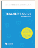
エコパーク日本平動物園の園外保育、校外学習をブラッシュアップ! ティーチーズガイド