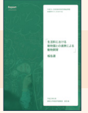
「生活科における動物園との連携による動物飼育」報告書