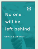
No one will be left behind "誰ひとり取り残さない"