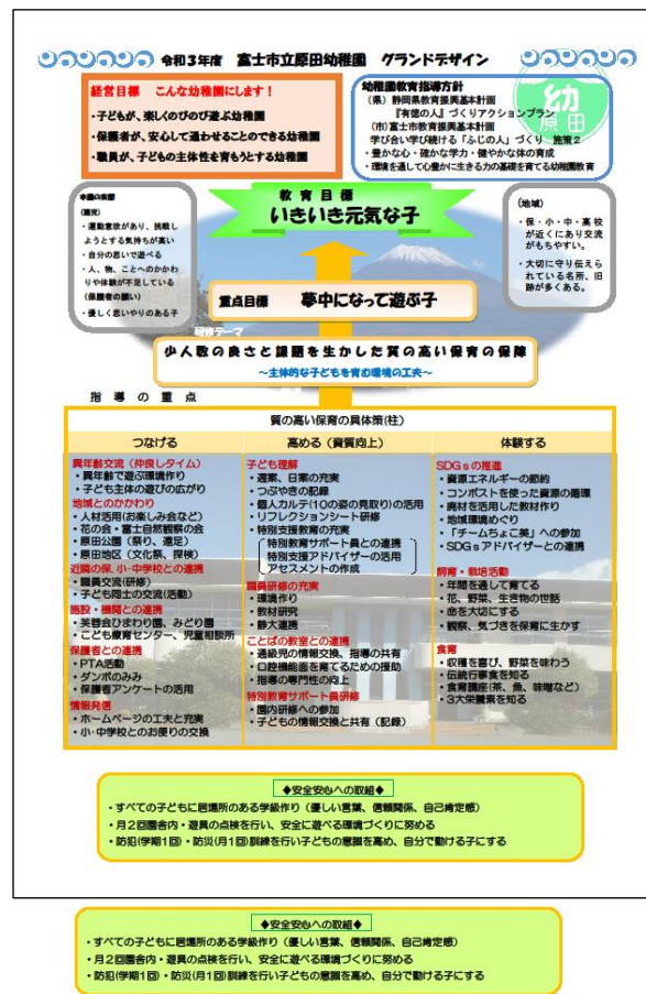
【図2】最初に掲げたグランドデザイン

このグランドデザインについて、園内研修 (2021年7月)では、以下のような対話が行なわれた。